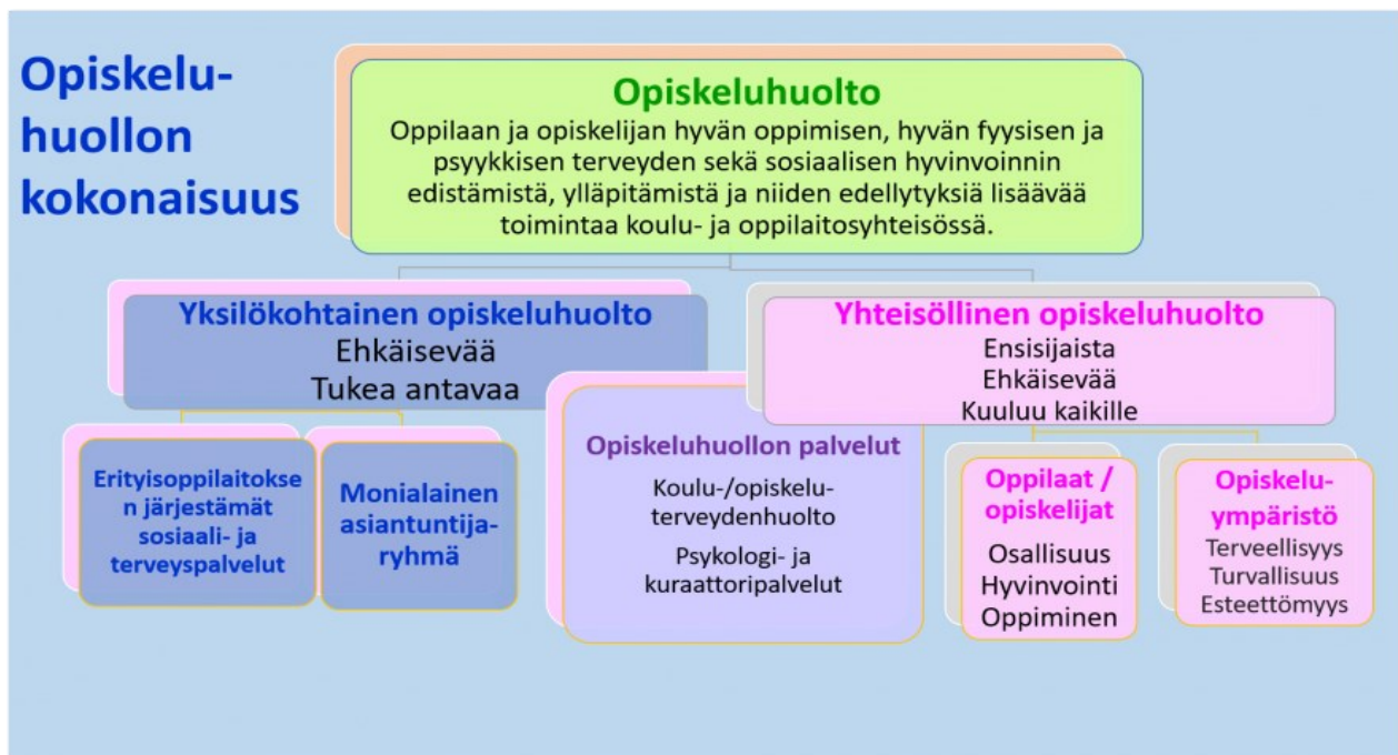
Kuva 1: Opiskeluhuollon kokonaisuus (Laitinen, 2019. Opetushallitus)